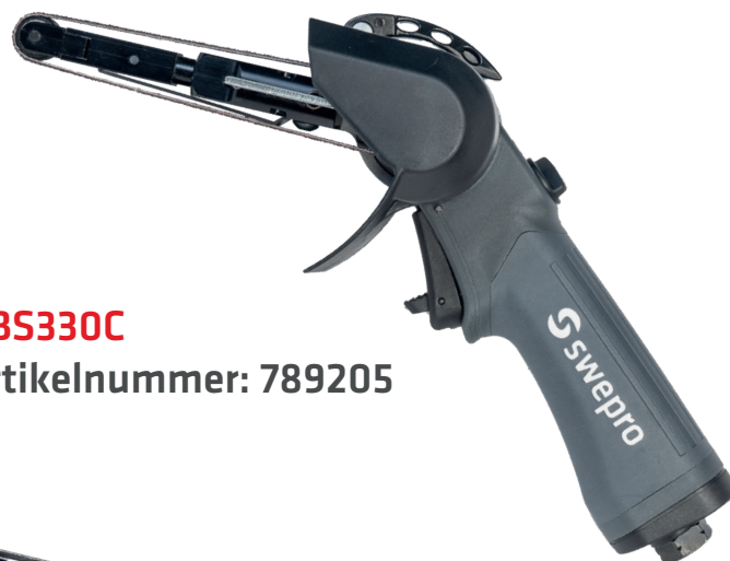
ABS330C Artikelnummer: 789205