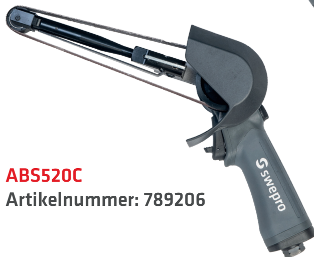
ABS520C Artikelnummer: 789206